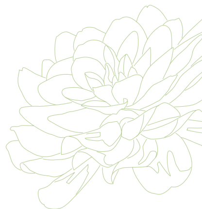
フルート 泉 真由